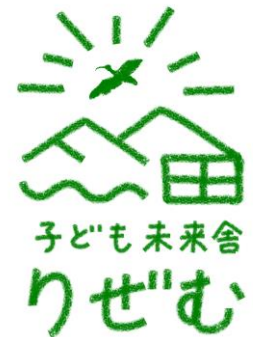
子ども未来舎りぜむ ロゴ

○ホームページ https://katagamimirai.wixsite.com/rizem