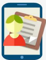
顧客情報の記録ができます