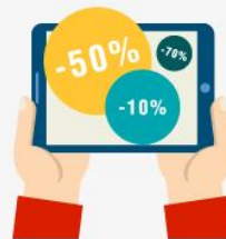
再来店を促すことができます