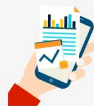
顧客が利用状況を確認できます