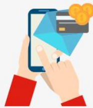
SMS・WEB・電話でクレジットカード決済ができます