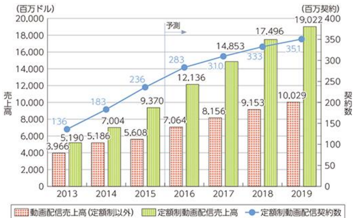
表: 世界の動画配信売上高・契約数の推移および予測

以上のような背景から、両社にて、創業間もないベンチャー企業や、既存企業の新規事業など、サブスクリプションモデルを採用するスタートアップの企業が、新産業の成長に人員を配分できる環境づくりをサポートすることを目的として、この度の連携ソリューションのリリースに至りました。