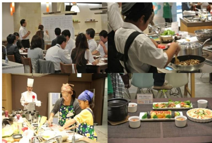
書類審査会と実技選考の様様