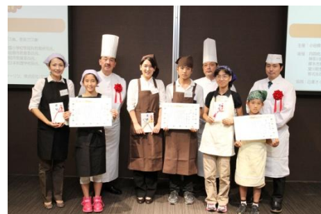
優勝・準優勝・第3位チーム

本コンテストは、家庭における食育の浸透を目的に、2007年度から開催している参加・体験型のお料理コンテストです。料理体験の機会を提供する事により、食生活の重要性を実感していただき、また、コンテストを通じて、親子のコミュニケーションがますます深まり、忘れられない思い出づくりの場として貢献しています。