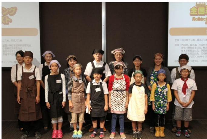
神奈川県大会実技選考出場8チーム

このコンテストは、親子で一緒に調理をすることで、料理の楽しさや食への関心を高める機会となることを目的として全国で開催中。各小学校の夏休みの宿題として取り上げていただくなど、年々学校教育の場でも、取り上げていただく機会が増えつつあります。神奈川県大会では、前年度を超える、3,500作品以上のご応募を頂戴しました。心より御礼申し上げます。そして、厳正なる書類審査のもと、出場チームが決定。10月12日（日）、東京ガス横浜ショールームにて、お料理大好き親子8チームによる、神奈川県大会（実技選考）が開催され、60分間の炎のお料理対決が繰り広げられました。豊かなアイデアと高い調理技術を秘めた優勝1チームは、11月30日（日）に開催される、関東中央地区大会に出場。がんばれ神奈川県代表チーム。目指せ、全国大会！