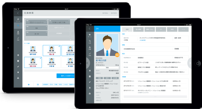
Astro Blaster for Talent Management 画面イメージ

本システムは WEB ブラウザ環境で動作する、デバイスフリーシステム (PC 及び iPad 推奨) です。操作端末へのシステムインストールは不要で、現在運用中の端末をそのまま利用するため、導入・運用のコストを大幅に抑える事が出来ます。オンライン環境であれば常に最新情報を取得できる為、地方事業所の人事担当や、チェーンストアのエリアマネージャーなども、常に欲しいタレントデータをノータイムで参照する事が可能です。