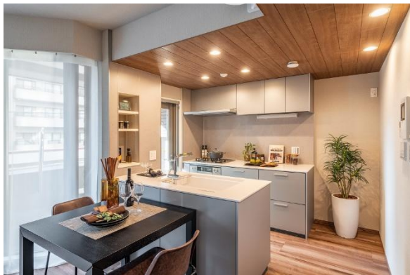
キッチン空間（奥側の天井が『グラビオ羽目板V』）

木目や石目など素材感の引き立つ建材を空間のアクセントとして使用しています。キッチンの天井部分には、木目の立体感ある風合いが魅力で不燃性にも優れた天井材『グラビオ羽目板V』を、リビングの壁面（一面のみ）には、石目柄の深彫調不燃壁材『グラビオエッジ』を採用いただきました。