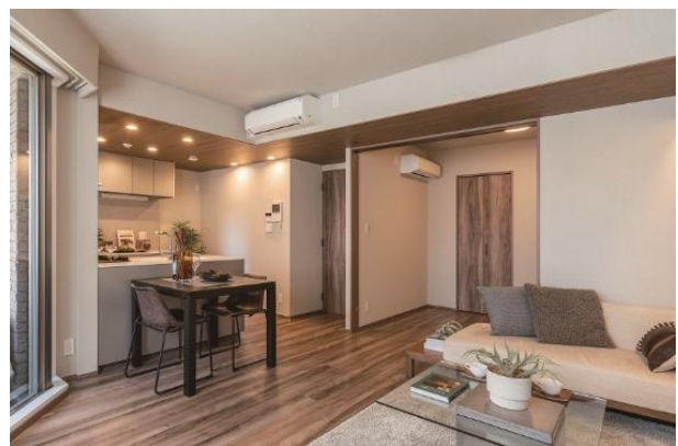
リノベーション後