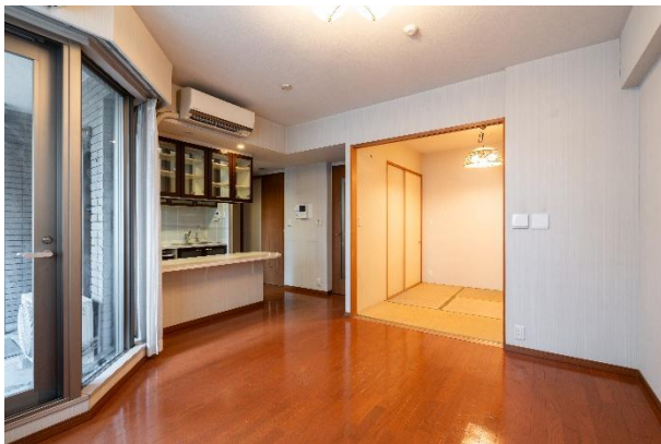
リノベーション前

DAIKEN株式会社（東京都千代田区、社長：清洲忠洋）は、このほど、首都圏エリアでマンションの販売を手掛ける明和地所株式会社との共同プロジェクトとして、当社の機能建材を多数用いて、東京都 文京区内のマンションの一室をリノベーションいたしました。立地や設備だけでなく、+αの付加価値が求められるリノベーション市場において、当社は、機能性・意匠面に優れた、空間の価値向上に寄与する製品の提案を通じて、誰もが過ごしやすい快適空間づくりに貢献してまいります。