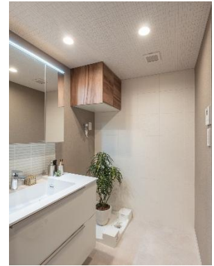
洗面空間 (奥の壁が『さらりあ〜と』、 天井が『クリアートーン 12SⅡ』)

洗面室・寝室の壁材には、空間の湿度に合わせて湿気を吸収・放出する調湿機能や、消臭機能を有する調湿壁材『さらりあ〜と シンプルクリーン』を、天井材には、音を吸収し、気になる反響音を抑え、かつ調湿性能も併せ持つダイロートン健康快適天井材『クリアートーン12SⅡ』を採用いただいています。当社機能建材の組み合わせにより、「調湿」「消臭」「吸音」の3つの性能を取り入れた、快適空間を実現しました。