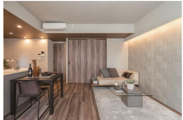
リビング空間（正面のドアと床材がバームブラウン柄）

床材と建具には、床材『イエリアフロア セレクト プレミアムウッド柄』と新建具シリーズ『イエリア セレクト』に、昨年新たに追加した、表情豊かな木質感の〈バームブラウン柄〉を採用いただいています。各部屋をトレンドカラーの“温かみのあるブラウン”で統一することで、空間に落ち着きと上質感を持たせました。