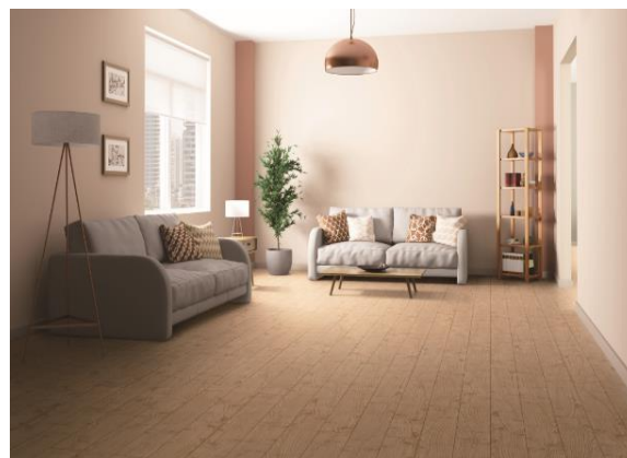
『トリニティオトユカ 45』を使用した空間イメージ