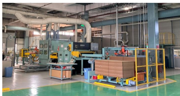
新たに設置した『トリニティオトユカ 45』の製造ライン

所在地：三重県津市河芸町 投資内容：「トリニティオトユカ専用ライン」 生産開始：2022年10月 生産能力：10,000坪/月 投資額：4億2千万円