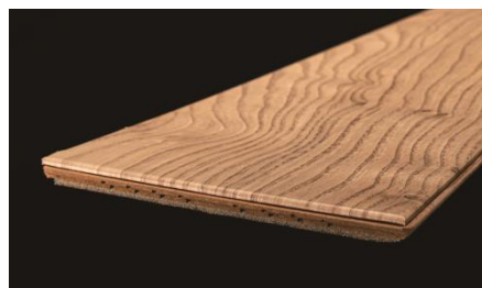
立体感のある張り上がりを実現（特許取得済）

一般的にシート化粧床材は、表面材として化粧シートを貼り、その後、床材加工をするため、床材四周の実加工・面取り加工部分は基材が露出します。そのため、その部分を隠すために、着色剤等で色を付けて仕上げます。一方『トリニティ』は、床材加工後に特殊化粧シートを四周木口面に巻き込み、床材の継ぎ目となる細部までを美しく仕上げることで、厚単板化粧床材のような立体感のある美しい仕上がりを実現しています。