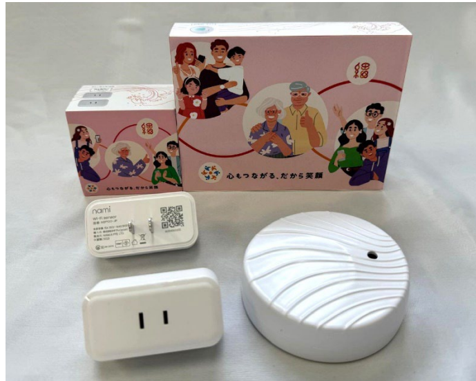
やさしいみもりキット