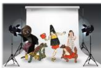
カッパ&もののけチェキ会