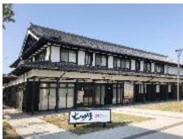
湯本豪一記念日本妖怪博物館（三次もののけミュージアム）外観