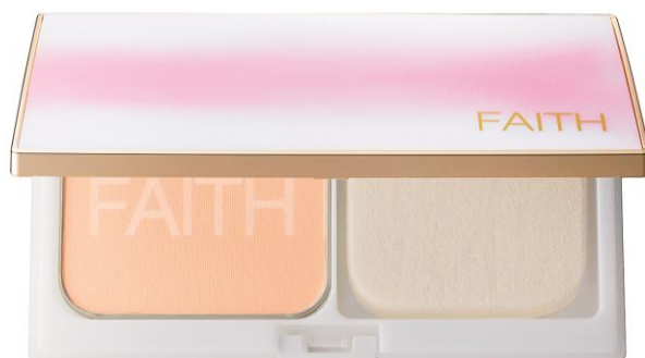
フェース インシスト シャイン パウダリー ファンデーション レフィル+ケース 各色 5,500 円（税抜き）

フェースグループ（本社：大阪市中央区、COO：小島真一）は、パウダリーファンデーションをメインアイテムとした新メイクシリーズ「フェース インシスト シャイン」を2015年4月8日（水）より新発売いたします。「フェース インシスト シャイン」は“輝き”をキーワードに、高機能と洗練されたデザインをあわせ持ち、活動的に生きる女性をスタイルアップするメイクシリーズです。