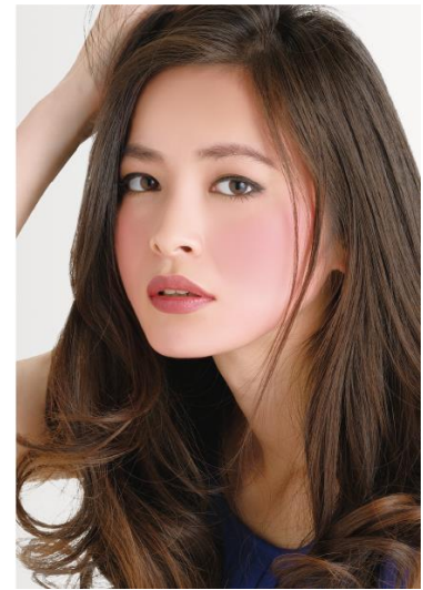
03 パールナチュラル

独自処方として、通常アイカラー等に配合される「偏光パール」をパウダリーファンデーションに独自の比率で高配合すること等、他にないフェースオリジナル処方を実現しました。