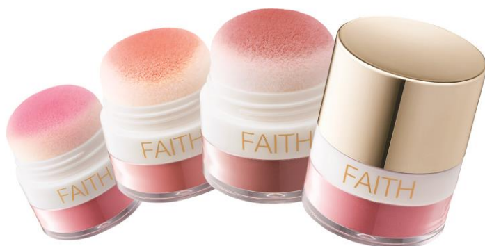
フェース インシスト シャイン デザインングチーク 各色 3,500 円（税抜き）