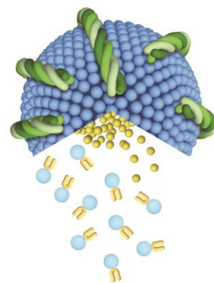
フェース生コラーゲン イメージ図