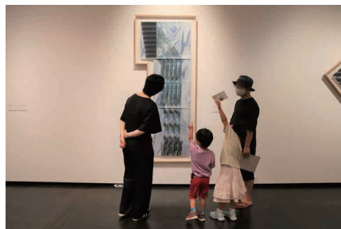
※画像は過去に実施した鑑賞会の様子です