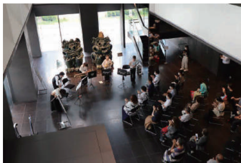
※画像は過去に実施したコンサートの様子です