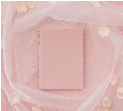
微笑むピンク Feathery Pink