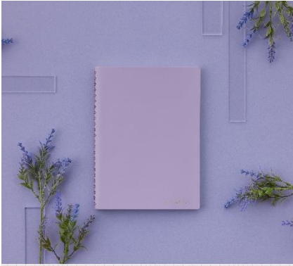
凩とするむらさき Classy Violet