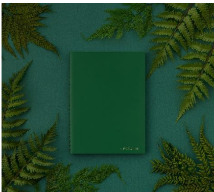
リセットする緑 Forest Green