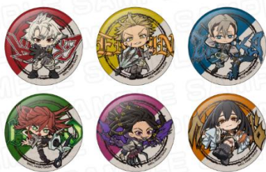
描き起こしのミニキャラを使用した缶バッジ（全6種）