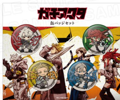
掃除屋アクタ所属メンバーを集めた缶バッジセット 価格：2,200円(税込)

※掲載内容・価格は予告なく変更する場合がございます ※画像は全てイメージです ※なくなり次第終了となります ※購入制限を設ける場合がございます