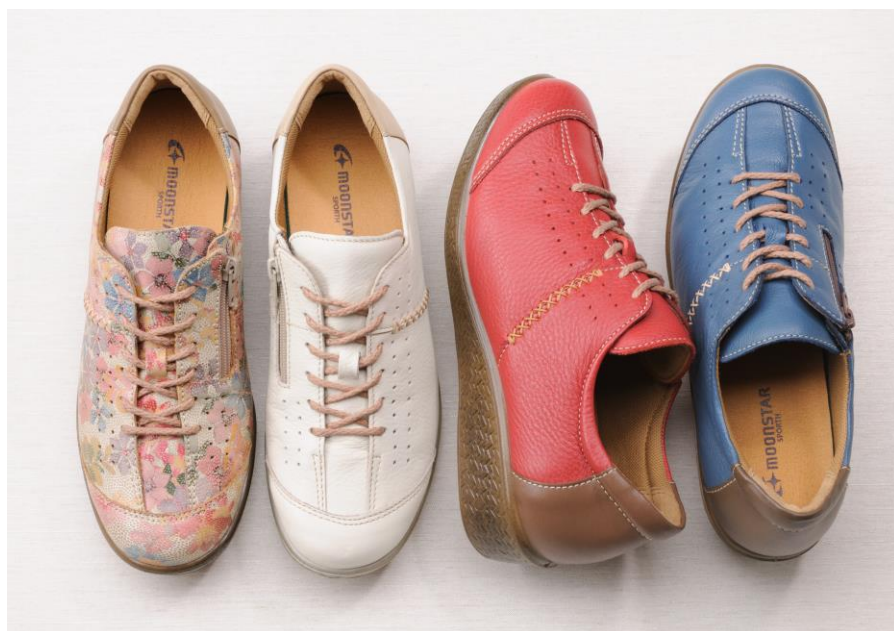
【ダブルクッション構造】

今シーズンはしなやかさと柔らかさが特徴で、衣類や手袋などに使用されることの多い「ガーメントレザー」を採用し、高いフィットング性を実現。ビビットなカラーリングや遊び心あるデザインを深みのある上質なレザーで仕上げることで、若々しさと品格を程よくミックスした「エイジレス」な大人カジュアルを表現しました。