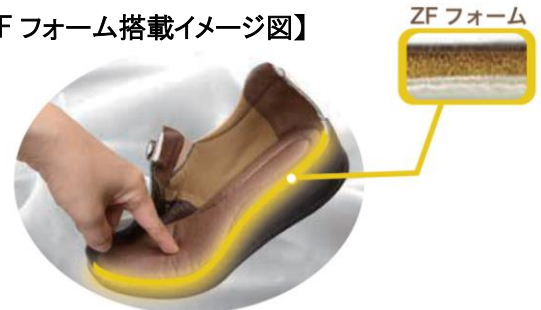
【ZFフォーム搭載イメージ図】