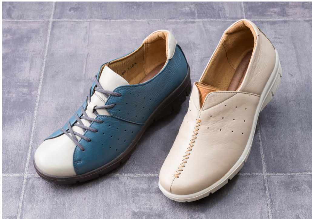
(左から)SP 2303 ブルーC、SP 2333 ベージュ サイズ:21.5～25.0 cm(4E) 税込価格:¥14,040-(本体価格¥13,000-)

株式会社ムーンスター(本社:福岡県久留米市/東京本社:東京都中央区八丁堀 社長:猪山 渡)は、洗練されたデザインと技術力で女性を足元から輝かせる「ムーンスター スポルス®」より、『シフォンリラックス』シリーズ新作2型9カラーを、2017年2月上旬より全国の百貨店・靴専門店・量販店にて順次発売します。