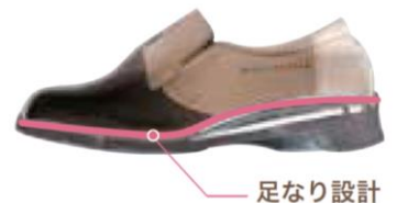
【足なり設計イメージ図】

足の特性にあわせて足裏にフィットするため、負担がかかりにくい設計です。人間工学に基づいた独自設計の足型(ラスト)を靴で再現するため、底材の成型と同時にアッパーへ接着する『ダイレクト製法』を用いています。国内でも対応している工場が少ないこの製法は、底材とアッパーがはがれにくく、屈曲性が優れていることも特徴です。