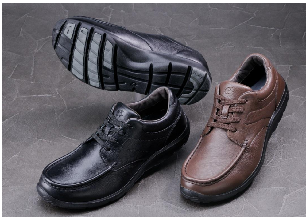
WM3069 カラー:(左)ブラック、(右)ブラウン 税込価格:¥12,960(本体価格¥12,000) 素材:天然皮革(ステア)

新作では上質なレザーが織りなす深みのある味わいと、高反発素材が生み出すスポーティで弾むような履き心地を両立させたデザインで「大人のハイブリッドシューズ」として仕上げたWM3069の他、カジュアルタイプWM3070、スポーティなウィメンズモデルWL3561、WL3562など全4型が登場します。