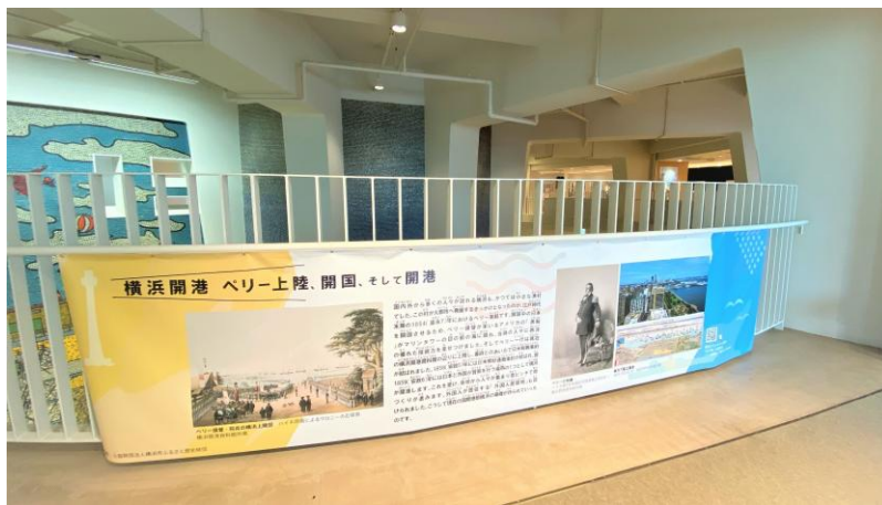
横浜マリンタワー（左）と歴史パネルの展示風景（右）