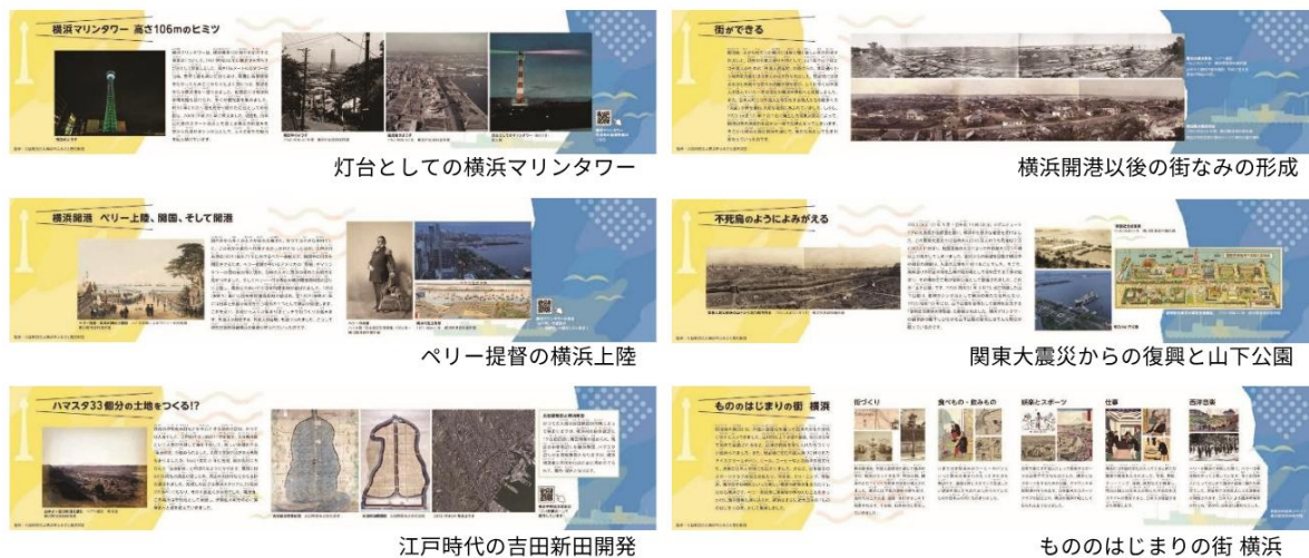
灯台としての横浜マリンタワー

灯台としてのマリンタワーやペリー提督の横浜上陸、関東大震災から復興で作られた山下公園の歴史などを紹介しています