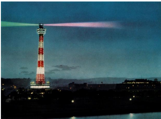
灯台として使用されていた時代の横浜マリンタワー

横浜マリンタワーは、横浜開港 100 周年を記念する事業の 1 つとして、1961（昭和 36）年に横浜港を照らす灯台として開業しました。高さ 106 メートルのタワーは当時、世界で最も高い灯台であり、周囲に高層建築がなかったためどこからでもよく目につき、展望室からは横浜港を一望できました。低層部には海洋科学博物館も設けられ、多くの観光客を集めました。約 50 年にわたり港を見守り続けた灯台としての役割は、2008（平成 20）年に終わりました。現在も、日本近代史のスタート地点とも言える横浜の街並みを空から見渡せるシンボルとして、人々に新たな魅力を伝え続けています。