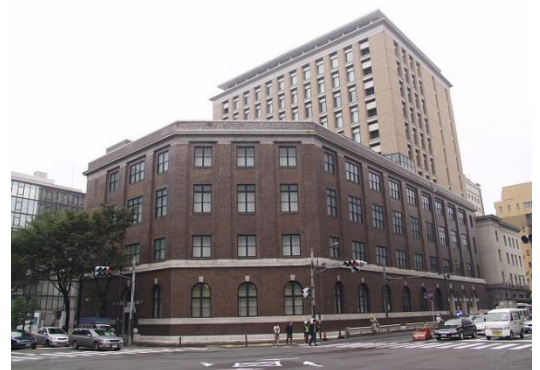
横浜市認定歴史的建造物「旧横浜市外電話局」を

建物は展示施設として大幅に手を加えられましたが、旧第一玄関だけは、改修前の雰囲気をそのまま残しています。2 階は横浜ユーラシア文化館常設展示室、4 階は横浜都市発展記念館常設展示室、3 階にある企画展示室では両館の企画展示を開催しています。歴史的な建造物とあわせてご覧ください。