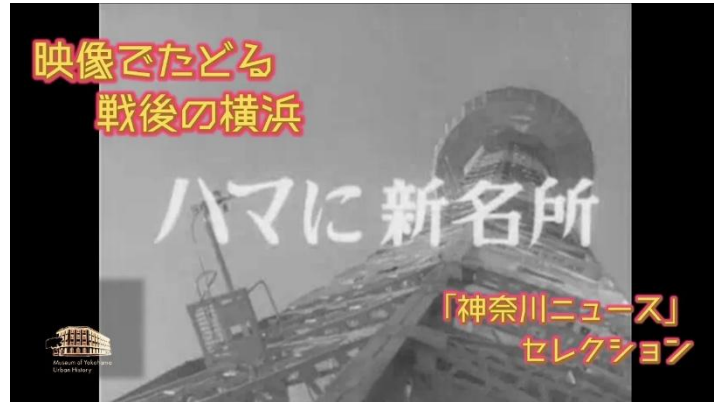
QR コードから横浜マリンタワー開業時の映像もご覧いただけます。