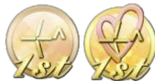
画像2 1周年記念バッジ