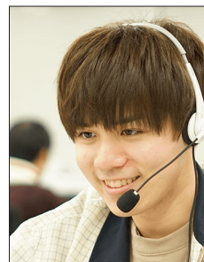
現役東大生チューター