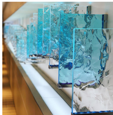
左：「勉強スポット募集 キャンペーン」