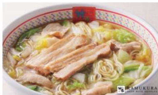
【神座看板メニュー：おいしいラーメン】 ※価格は店舗によって異なります。