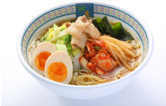
■冷たいおいしいラーメン