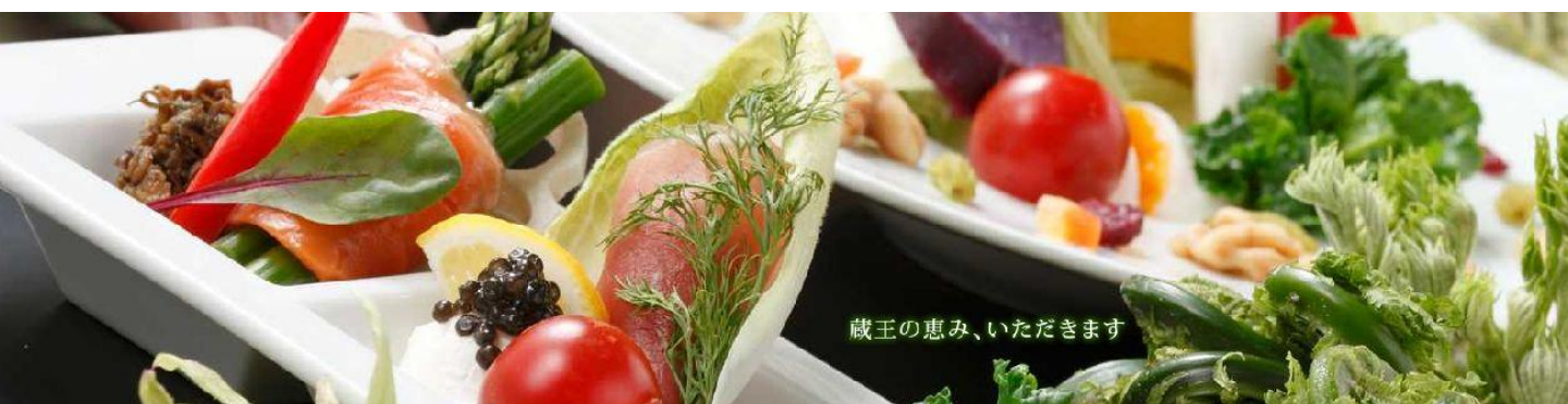
蔵王の恵み、いただきます

美容と健康をテーマにしたバーデン家壮鳳では、お料理にもこだわり、お客様の食生活を考え、食材には宮城県南産のフレッシュ野菜をたっぷり使用しております。宮城蔵王の自然の恵みに感謝し、四季折々の県南産の食材にこだわります。