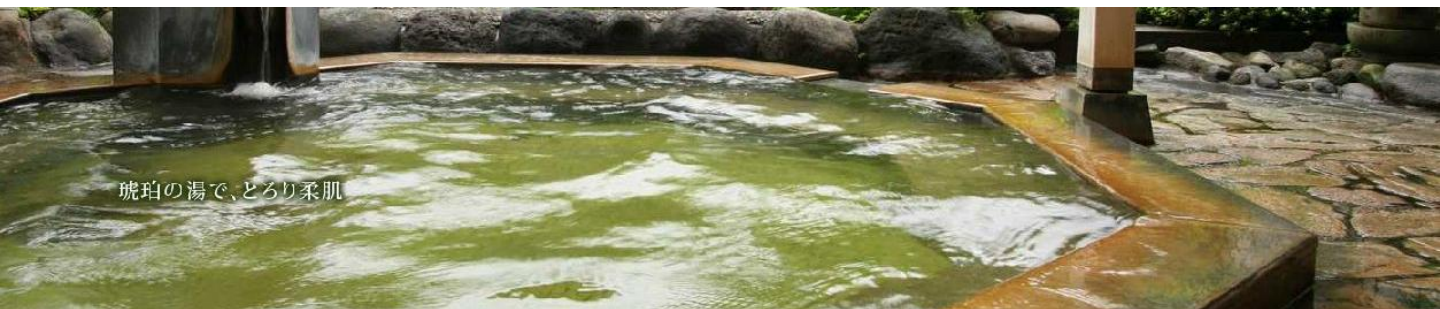
琥珀の湯で、とろり柔肌

無臭でほんのり琥珀色のやわらかい湯で、リウマチ、皮膚病、アトピー、婦人病に効くほか、発汗と脂肪燃焼によるダイエット効果も期待できます。また、ナトリウムイオンも多く含まれ、皮膚の脂肪分や分泌物等を乳化して洗い流し、ツルツルのキレイな肌「美肌」になれるのです。