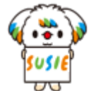
マスコットキャラクター「SUSIE（スージー）」