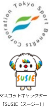
マスコットキャラクター 「SUSIE（スージー）」

【報道関係者からの問合せ先】 （公財）東京都スポーツ文化事業団 広報企画担当 TEL：03-6380-4106（平日9:00～17:00） メール： kouhou@tef.or.jp