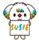
マスコットキャラクター「SUSIE（スージー）」