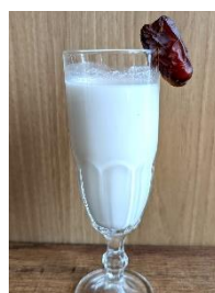
ソビア ¥ 440