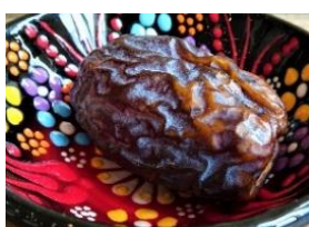
キングソロモン ¥ 330

その他、スーパーフードのデーツ(キングソロモン)やココナッツを使用したデザートなど、中近東地域で食べられる人気のスイーツも多数ご用意します。