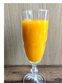
アマルエッディーン ¥ 440