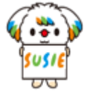
マスコットキャラクター 「SUSIE (スージー)」