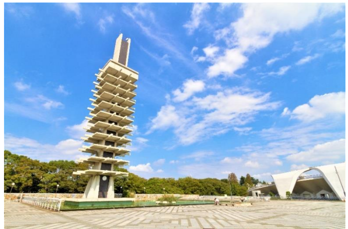
都立駒沢オリンピック公園中央広場 (世田谷区・駒沢公園)

スポーツが日常に溶け込んだ「スポーツフィールド・東京」の牽引役として様々な事業を戦略的に展開する公益財団法人 東京都スポーツ文化事業団（渋谷区・千駄ヶ谷、以下「東京都スポーツ文化事業団」）は、2024年3月9日（土）、都立駒沢オリンピック公園中央広場にて、誰もが気軽にスポーツを楽しめるイベント「スポーツフェスタ WINTER 2024 in KOMAZAWA」を開催します。