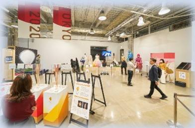
東京2020大会のレガシー展示（全体）