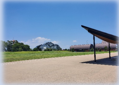
【夢の島公園アーチェリー場】