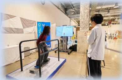
競技体験（e-スケートパーク）