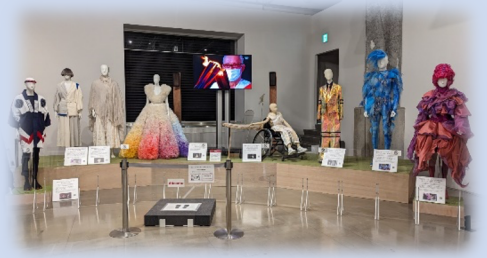
東京2020大会のレガシー展示（開会式エリア）

スポーツが日常に溶け込んだ「スポーツフィールド・東京」の牽引役として様々な事業を戦略的に展開する公益財団法人 東京都スポーツ文化事業団（渋谷区・千駄ヶ谷、以下「東京都スポーツ文化事業団」）は、各施設での競技観戦・スポーツ体験会の機会等を提供し、広く施設に親しんでいただくため、「都立スポーツ施設周遊バスツアー」（年7回予定）を実施しています。