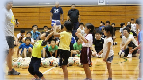
【ラグビー体験教室（イメージ）】