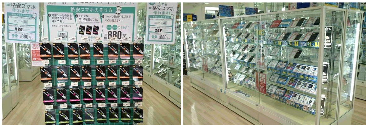
※店舗内観イメージ (Smart&Collection 名古屋大須店)

今回、「メディアランド秋葉原店」を全面改装しオープンする「 ゲオアキバ店 」は、“ゲオショップ”として秋葉原に出店する初の店舗で、 ゲオが運営する総合モバイルショップ「Smart&Collection」が併設された複合型店舗 となっています。“格安スマホ”の登場や総務省のSIMロック解除の方針発表により市場が活性化している、“中古携帯×SIMカード”を強化し、各商材の激戦区である秋葉原に出店します。1F～3Fまでを主に中古携帯を扱う「Smart & Collection」フロアとして、4F～6Fは、ゲオショップの主力商材であるTVゲーム、トレーディングカードゲームを中心に展開。店内に、タッチパネル式の購入補助端末を導入した都市型のモデルショップとなっております。