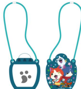
※オリジナルコインケースイメージ画像