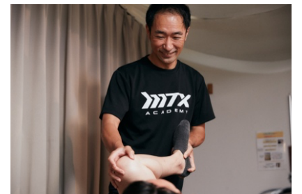
写真5 柔道整復師による回復治療

■MTX ACADEMY（回復）：最新治療器と手技を合わせた MTX 独自の治療法