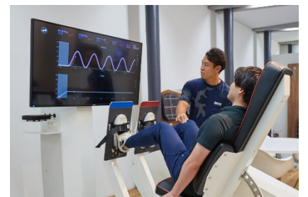
写真4 最新機器を使った運動療法

■MTX アカデミー：子供からご年配の方、アスリートまで担当するトレーナー陣が所属