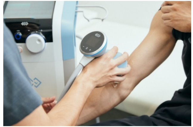
写真1 様々な部位に適応する体外衝撃波

代表的な関節疾患である変形性膝関節症で悩んでいる高齢者は、日本国内で潜在層も含めて約 3,000 万人いると言われています(介護予防の推進に向けた運動器疾患対策について報告書、2008)。今後、ますます上昇する高齢化率と共に増加する関節疾患は、発症すると痛みで日常動作や歩行が困難になりはじめ、運動不足となり、その結果、生活習慣病発症のリスクや生活の質全体の低下につながります。加齢と共に発症リスクの上がる関節疾患の症状改善には、治療だけでなく、運動療法を用いた予防も重要であると考えています。当クリニックでは、「治療＝再生医療」と「予防・リハビリ＝運動療法」を一か所で提供できる関節治療の総合施設をつくることで、健康寿命を延ばし、寝たきりゼロ社会の実現に貢献したいと考えております。