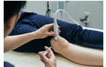
写真3 症状のある部位に行う関節注射