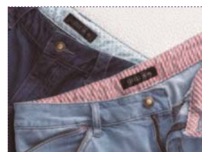
ウエスト部分の裏には、ストライプやドット柄の別布を縫い合わせています。