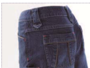
ポケット口などの刺しゅうステッチはデニムブルーに映える赤糸を使用。