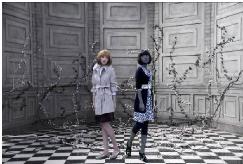
09年「nissen,」春号カタログTV-CM「二人の私」篇の1シーン

～09年「nissen,」春号カタログ商品のコーディネートで広がる、女性の美しさの無限の可能性～