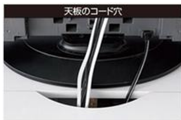
天板にコード穴があり、複数のコードをまとめて通すことができます。