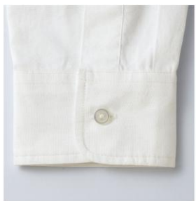
折り返してもきれいな細めの幅