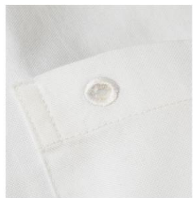
ピンバッジなどを飾れる穴付き