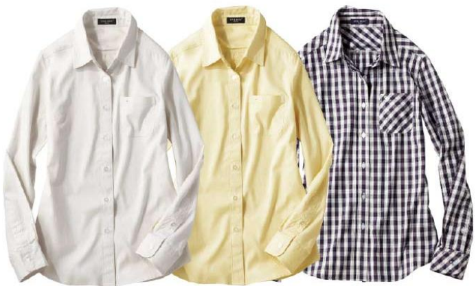
一着は持ちたい 基本カラー！