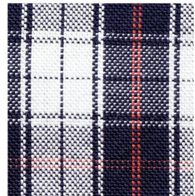
織細なオックスフォード織りだから、 チェック柄もキレイめ仕立て