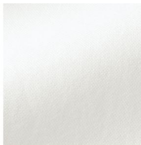
柔らかなピンポイントオックス織り