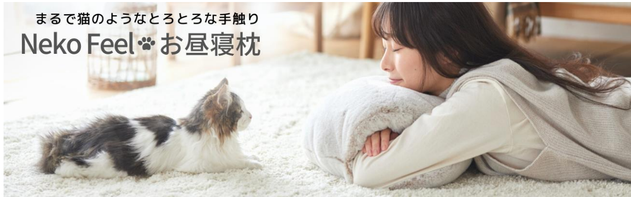
まるで猫のようなとろとろな手触り Neko Feel ® お昼寝枕

株式会社ニッセン(本社:京都市南区、代表取締役社長:羽瀧淳)は、オリジナル寝具ブランド「猫Feel (以下、猫フィール)」の新商品「お昼寝枕」を、ニッセンオンラインショップ( https://www.nissen.co.jp/ )で5月22日(月)より販売開始いたしました。