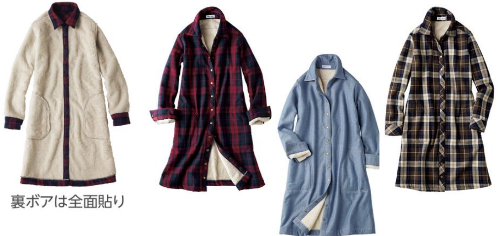
裏ボアは全面貼り

裏側が全面ボアのぬくぬくシャツワンピースが新登場。綿 100%の表地に、裏は袖まで全面ボアを使用。ふわふわに起毛した毛足が長い素材は、肌ざわりがよくぬくもり感も満点です。1枚仕立てで生地がもたつかずスッキリ着こなせます。しっかり暖かで重ね着いらず、前開きで羽織として着るのもオススメ。