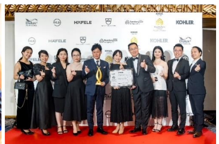
▲授賞式後の記念撮影