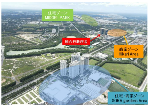
▲ビンズン新都市内の開発エリア イメージパース