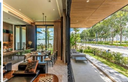
▲MIDORI PARK The TEN 内観