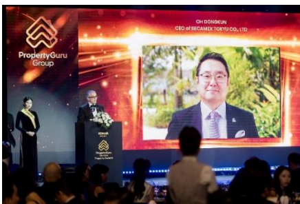
▲司会者による受賞者の紹介

「TOKYU Garden City」プロジェクトは、「Always NEW!」をコンセプトに掲げ、ベトナム国内において常に先進的な取り組みに挑戦し、これからも持続的なまちづくりと新都市の発展に貢献していきます。