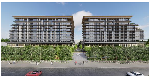
▲MIDORI PARK The TEN 外観