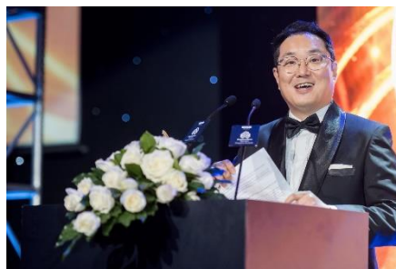
▲受賞者によるスピーチ