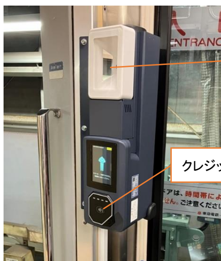
▲車内に設置された読取機器

※ 2 「QRコード」は株式会社デンソーウェーブの登録商標・JIS、ISO規格です。