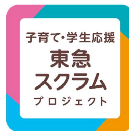
▲本プロジェクトロゴ

また「スクラム」という言葉には、東急(株)グループが子育て世帯の皆さんとスクラムを組むという意味と、東急(株)グループが一丸となってスクラムを組み子育て世帯や学生の皆さんを力強く応援していくという2つの意味が込められています。