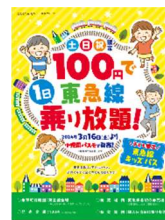
本乗車券のポスターイメージ

土休日に小児のお客さまが100円で東急線を1日乗り降り自由でご利用いただける企画乗車券です。通常の東急線ワンデーパス(小児:390円)と比較して約7割以上もお得になることから、「お得に乗車で嬉しい」などの声をたくさんの子育て世代のお客さまからいただいています。また、鉄道利用の促進や途中下車の増加による回遊効果など、東急線の地域活性化にも繋がっています。より多くの子育て世帯のお客さまにご利用いただくことで、経済的な負担を軽減し、土休日の鉄道でのお出かけをサポートします。