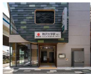
駒沢大学駅のエレベーター

2024年6月29日には駒沢大学駅において西口エレベーター(改札階～地上階)の運用を開始。東急線沿線で8駅目となるバリアフリールートが複数ルートある駅となりました。