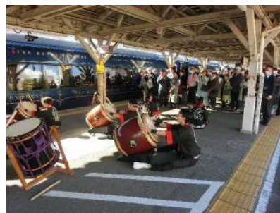
▲地元高校生による歓迎太鼓 【2024年運行の様子】