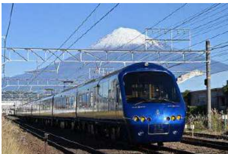
▲富士山のふもとを走行