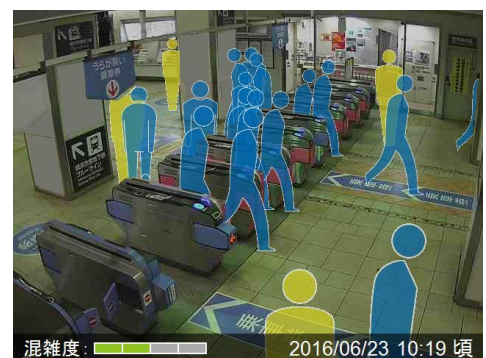
(配信画像イメージ)