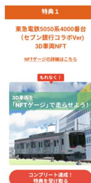
▲コンプリート特典の受け取りイメージ