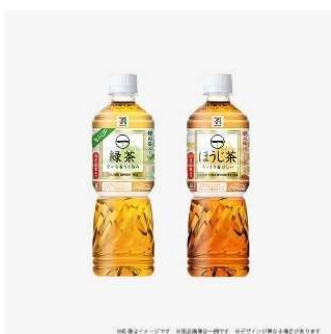
▲セブンプレミアムお茶デジタルギフト イメージ

https://giftee.com/items/5182?srsId=AfmBOopMPenOGjdSY70CQqNqac909vJ_ClhWAs3tedNtcVi8gGoiz24y