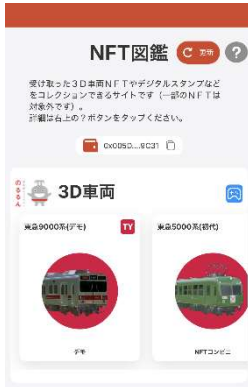
▲「NFT図鑑」反映イメージ①

https://www.sushitop.io/22nftgauge/tokyu/Illustrated-book/index.html