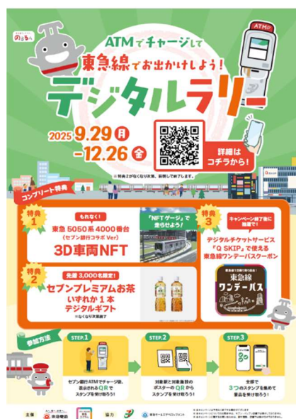
▲本キャンペーンポスター イメージ