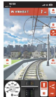
▲ゲーム性を持たせた機能イメージ