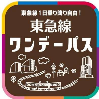
▲「Q SKIP」で使える東急線ワンデーパスクーポン イメージ