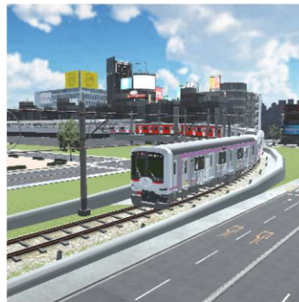
▲「NFTゲージ」の走行イメージ