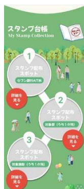
▲「スタンプ台帳」のイメージ

全スタンプをコンプリートした方は、「スタンプ台帳」ページの「特典を受け取る」ボタンをタップできるようになり、特典を受け取ることができます。