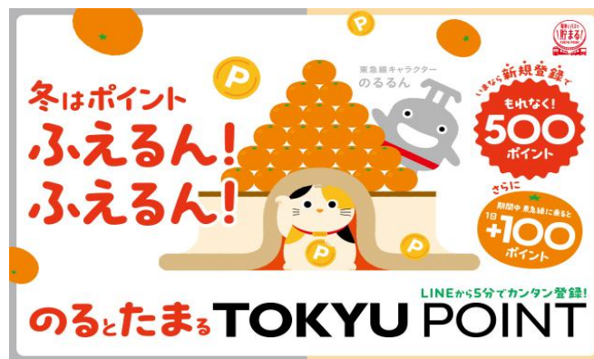
▲本キャンペーンポスターイメージ