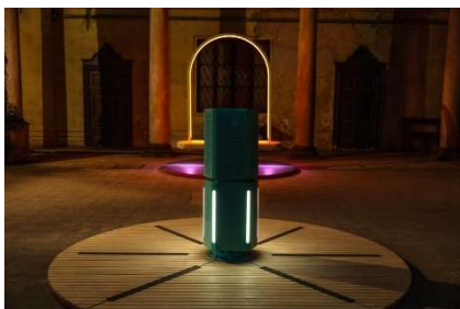
▲“Hello ! Duetti”設置イメージ

当社は、「DIG SHIBUYA 2026」への参画を通じて、国内外の関係各所と連携しながらさまざまな施策を実施し、渋谷への来街促進と、「エンタテインメントシティSHIBUYA」のさらなる進化を目指します。