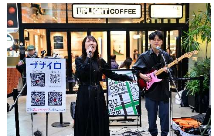
▲Shibuya Street Live × DIG SHIBUYA 2026イメージ