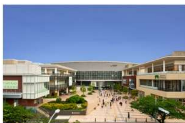
たまプラーザ テラス