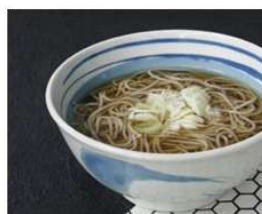
しぶそばご優待券