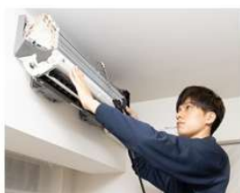
東急ベル ハウスクリーニングチケットなど