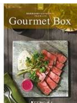
東急百貨店 選べるカタログギフトなど