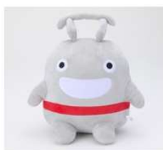
東急電鉄 東急線キャラクターのるるんグッズなど