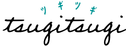
▲定額制宿泊サービス「ツギツギ」ロゴ