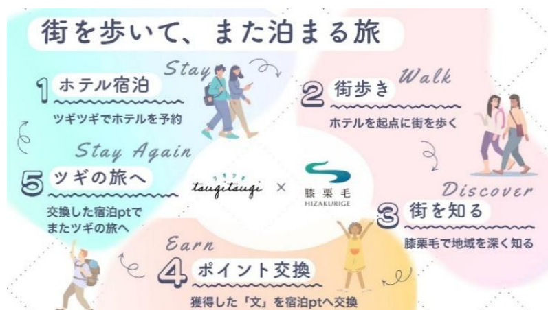
▲本提携によるまち歩きと宿泊を接続した地域回遊の循環イメージ

東急は交通・不動産・生活サービスなどを通じた「まちづくり」を事業の根幹に据え、地域に人の流れを生み出す取り組みを進めてきました。アットホームは不動産情報サービスを基盤としながら、地域との接点づくりや地域共創の取り組みを展開しています。両社が取り組んできた地域との接点づくりを生かして、まち歩き体験と宿泊を接続する本提携を開始することで、まち歩きによる地域の魅力発見と宿泊による滞在体験を接続し、地域との継続的な関係づくりを促進します。今後も、まち歩きと宿泊を組み合わせた新しい地域体験の創出を通じて、地域への来訪促進や関係人口の拡大、地域活性化につながる取り組みを推進します。