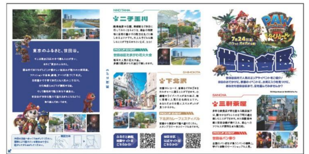
▲寄附金受領証明書