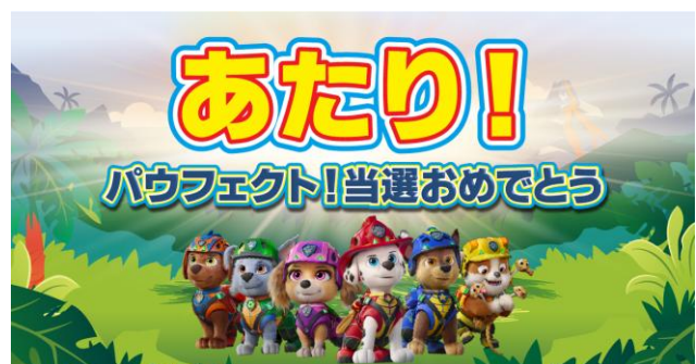
▲当選連絡イメージ