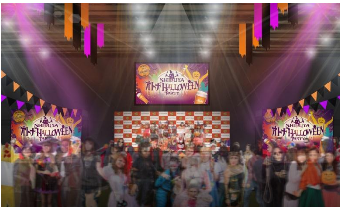
「仮装コンテスト」イメージ